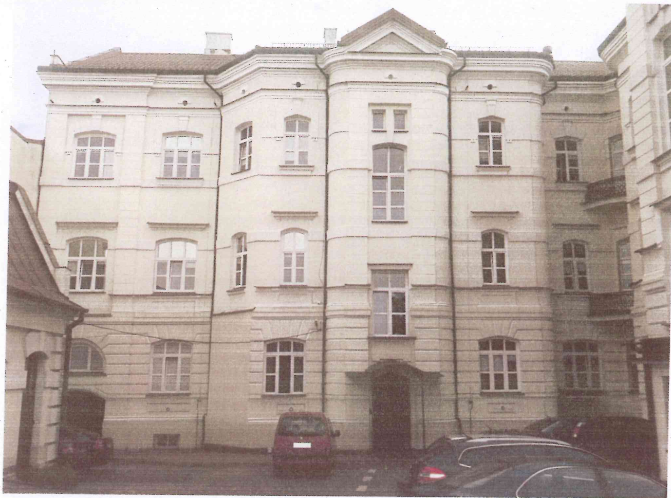
Foto. 1. Elewacja południowa.